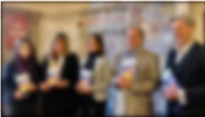
Parte da Pisa il primo corso per rendere i musei accessibili alle persone con autismo